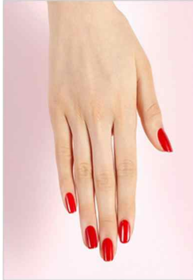
<오른손 레드 풀코트>