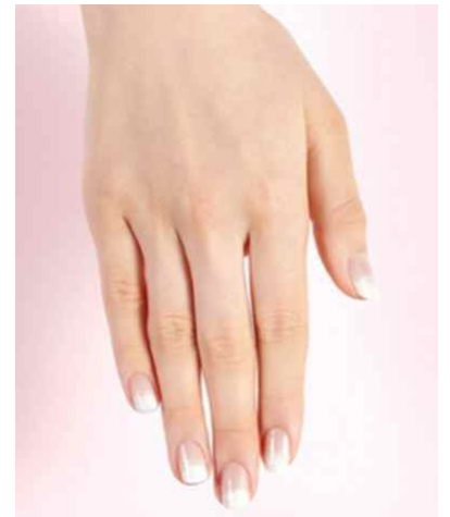
<왼손 화이트 그라데이션>