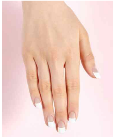
<왼손 화이트 딥프렌치>