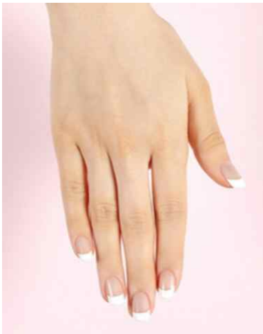
<왼손 화이트 프렌치>